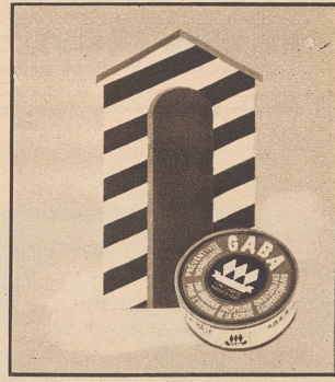
Gaba nehmen — Gaba nützt, Gaba schicken — Gaba schützt!