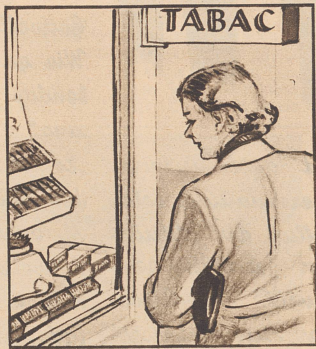
Gleich am nächsten Sonntag soll er ein Päckli haben. „Wenn ich nur wüsste, was er mag: Cigaretten, Stumpen oder Tabak?“