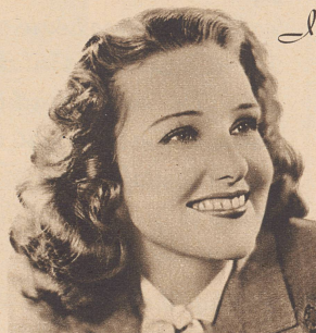
Lola Lane, Star of Warner Bros. Pictures, appearing in "Four Daughters".