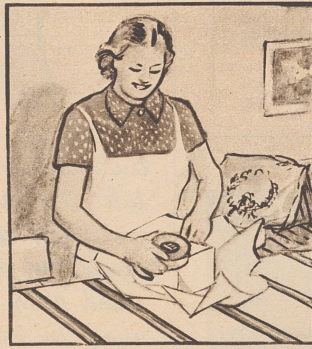
„Von jedem etwas, Und dazu eine grosse Schachtel Gaba, die ist so wieso recht.“