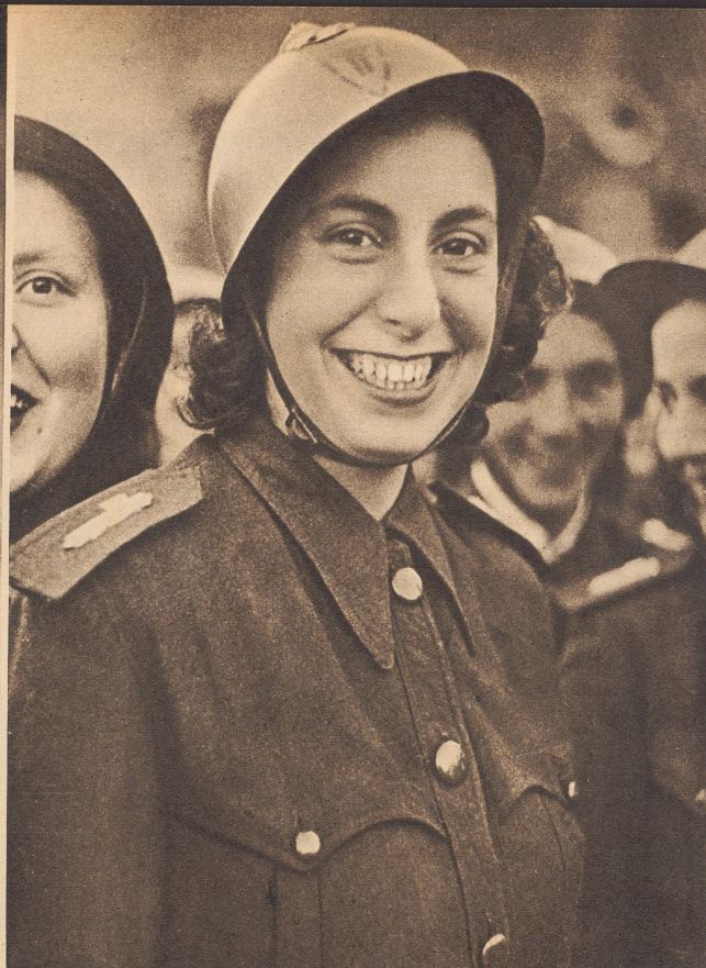
Junge Italienerin, die im Luftschutz tätig ist, in Uniform und Stahlhelm.