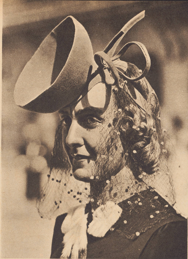
Dieser Französin mit dem originellen Hü- chen dürfte das Kopfnicken schwer fallen, wenn die Pracht auf der Stirne halten soll.