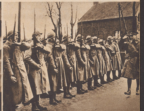
König Georg VII. stattete den in Frankreich eingesetzten englischen Truppen einen Besuch ab. Aber auch die Poilus bekamen ihn zu sehen. Bild: Der König begrüßt ein Detachement französischer Soldaten. ...et jusqu'aux poilus sur le front de France.