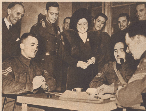
König Georg, begleitet von der Königin, eröffnete den Beaver Club, der für die kanadischen Truppen in England bestimmt ist. Bild: Das Herrscherpaar verweilt während des Rundgangs durch das Gebäude im Erholungsraum bei den damenspielenden Kanadiern. ...inaugurent des cercles, tel ce «Beaver-Club», réservé aux soldats canadiens cantonnés en Angleterre...