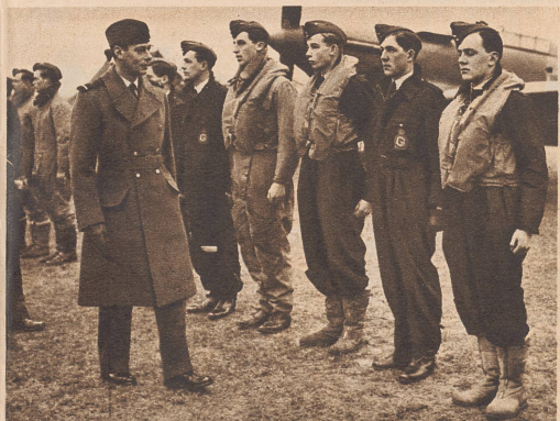
Verdienstvolle Piloten der britischen Luftstreitmacht werden vom König mit Orden ausgezeichnet. ...les pilotes de la R. A. F....