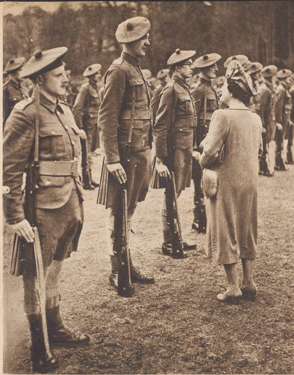
Die Königin im Gespräch mit einem besonders großgewachsenen Schotten während eines Besuches bei den in Kent stationierten Schotten. ...les célèbres soldats de l'Ecosse...