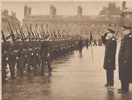
König Georg nimmt bei der Inspektion der königlichen Marine die Parade ab. ...les fusiliers marins...