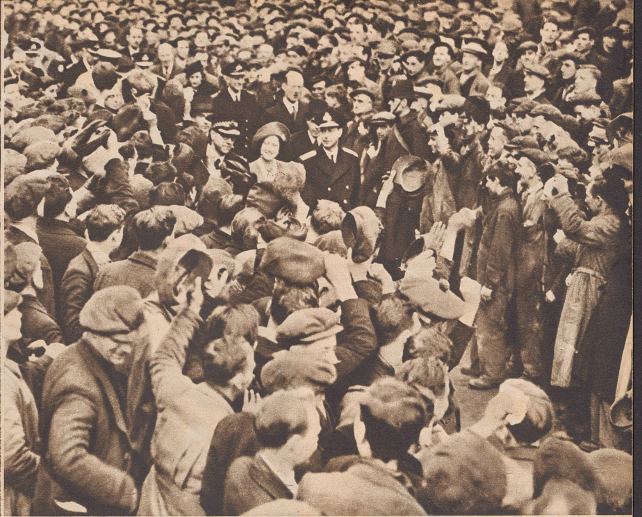
Das englische Königspaar wird beim Besuch einer Schiffswerft von den Arbeitern begrüßt. ...visitent les chantiers navals d'Ecosse...