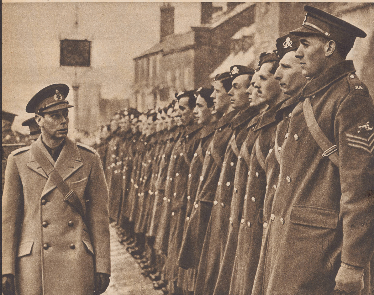
Der König bei einer Truppeninspektion. ...les fantassins...

D'une aube à l'autre à travers tout le pays Leurs Majestés britanniques se dépensent sans relâche . . . inspectant . . .