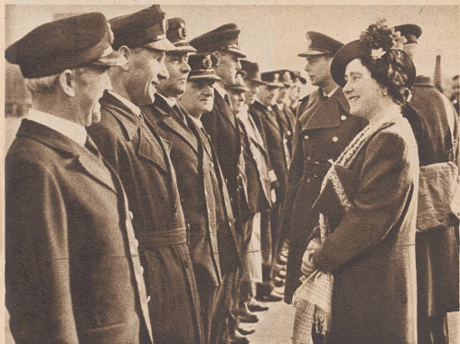
Königin und König im Gespräch mit Handelsschiff-Kapitänen bei einer Inspektionsreise zur Südwestküste, die den Besuch von Handelsunternehmen, Zivilverteidigungsanlagen und einer Flugzeugfabrik mit sich brachte. ...les capitaines de la marine marchande