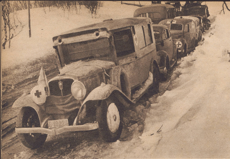
Norwegische Ambulanzwagen auf der Fahrt nach vorne zur Abholung Verwundeter. Un convoi norvégien d'ambulances, prêt à partir vers l'avant.