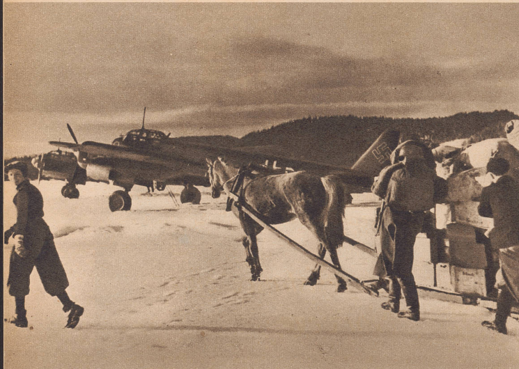
Im Süden Norwegens ist der Frühling angebrochen, in Mittel- und Nordnorwegen liegt noch eine alte, vielerorts einen Meter messende Schneedecke über dem Land. Die noch nicht geschmolzenen Eisdecken der Seen dienen den deutschen Bombern und Warentransportflugzeugen als Start- und Landeplätze. Si dans le Sud de la Norvège le printemps est déjà là, le Nord et la moyenne Norvège subissent encore les rigueurs de l'hiver et par place la couche de neige atteint encore un mètre. Les Allemands utilisent comme place d'atterrissage la surface glacée des lacs.