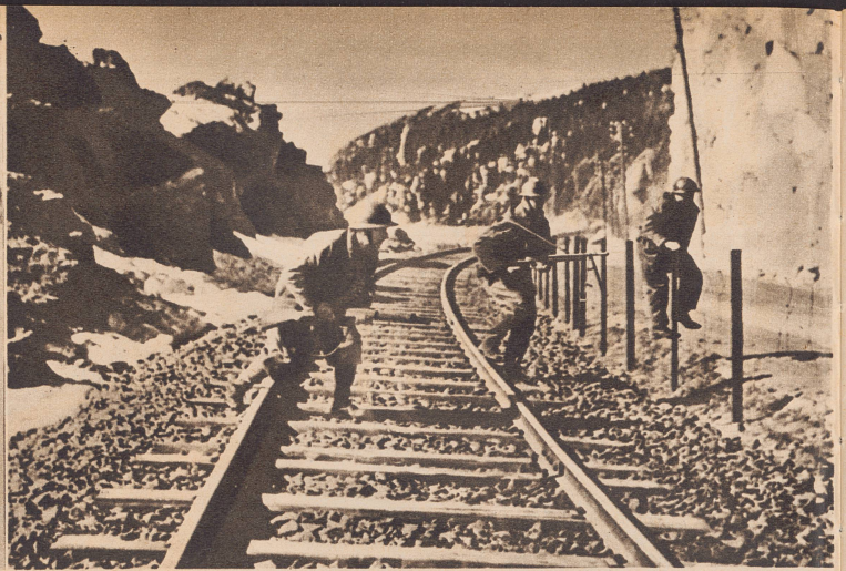
Französische Patrouille an der Narviker Erzbahn. Patrouille française sur la voie ferrée de Narvik.