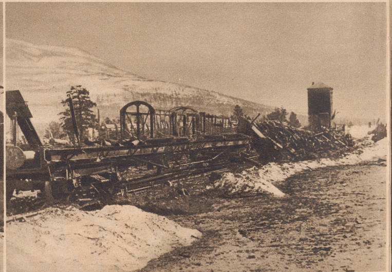
Ausgebrannte Eisenbahnwagen in einem Hafenort Südnorwegens. Wer das Zerstörungswerk vollbracht hat, ist nicht festzustellen. Die Deutschen mit ihren Bombenangriffen oder die Engländer vor ihrem Abzug in die Heimat? Dans un port du sud, des wagons de chemin de fer détruits par les bombardements.