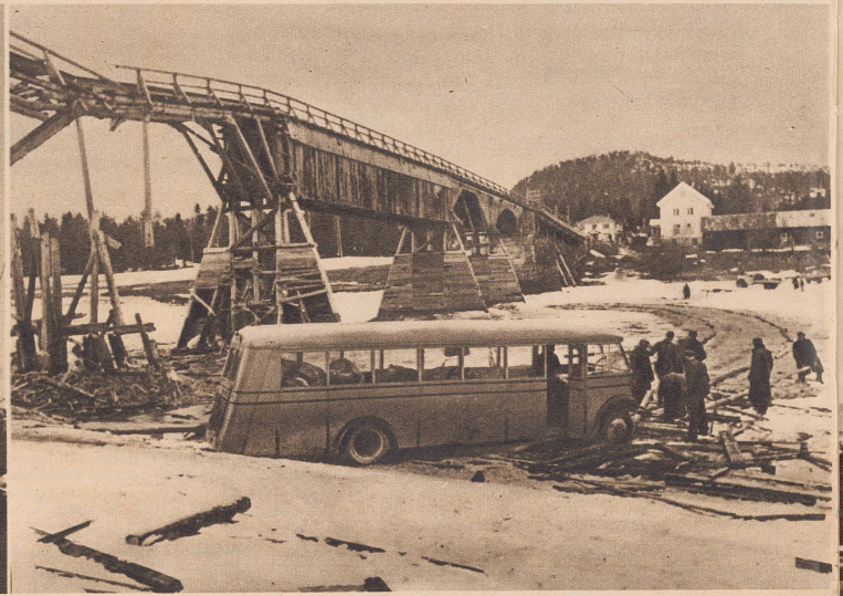
Von den Norwegern zerstörte Holzbrücke im Namdal hinter Namsos. Deutsche Soldaten sind dabei, für den Bus eine Furt durch den Namsosfluß herzustellen. Pont de bois, détruit par les Norvégiens, dans le Namdal, près de Namsos. Des soldats allemands construisent un passage pour utiliser l'autobus à travers le fleuve.