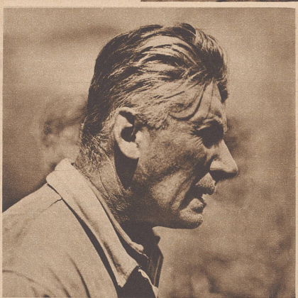
Der geistesgegenwärtige Lenker des Wagens nach dem Unfall, aus dem er mit dem Schrecken davonkam.

Le chauffeur du camion, photographié après l'accident.