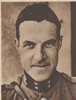
† Oberleutnant Emil Gürtler.

Le samedi 8 juin, un avion suisse d'observation se heurta à six avions allemands au-dessus de l'Ajoie et est abattu aux environs d'Alle. L'équipage, le pilote Meuli et l'observateur Gürtler, sont tués.