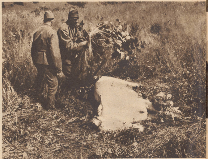
Sterbendes Spahipferd. Es ist den Strapazen des Rückzuges erlegen und zwei Kilometer von der Grenze, gleich nach der Ankunft in der Schweiz, zusammengebrochen. Es war nicht mehr auf die Beine zu bringen, und so löschte ein Schuß sein Leben aus. Sein Besitzer weinte, und die Schweizer Soldaten legten eine Laubdecke über den Kadaver. Fern in Afrika, am Rande der Sahara, war der Hengst geboren, auf einer blühenden Berner Juramatte ist er gestorben.

Des soldats suisses recouvrent de branches et de verdure un cheval de spahi, tombé peu après son entrée en Suisse. Il sera abattu d'un coup de revolver un peu plus tard. N/S 1048