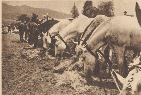
Trainpferde der übergetretenen polnischen Division im Biwak von Courroux. VI S 3745

Photos de l'entrée et du désarmement en Suisse, d'une partie de l'armée française. 40 000 hommes et 8000 chevaux environ ont franchi notre frontière entre les 19 et 21 juin 1940.