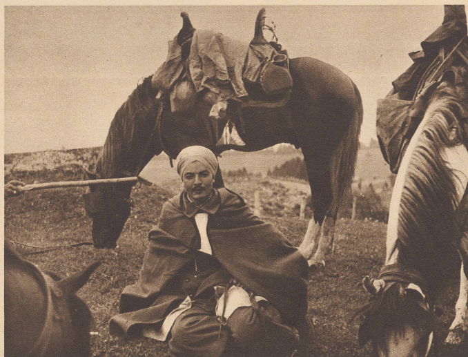
Spahisoldat mit seinem gesattelten Araberhengst. Der rote Mantel des Mannes, seine Pluderhose, sein Turban, der Sattel mit dem hohen Sattelknopf, der breite, kunstvolle Steigbügel und die Scheuklappen am Zaum zeigen die ganze Romantik dieser nordafrikanischen Reitertruppe.

Un spahi et sa monture arabe. Les spahis, troupe montée nord africaine, portent encore un riche et romantique uniforme: manteau rouge, pantalons bouffants et turban. N/S 1014