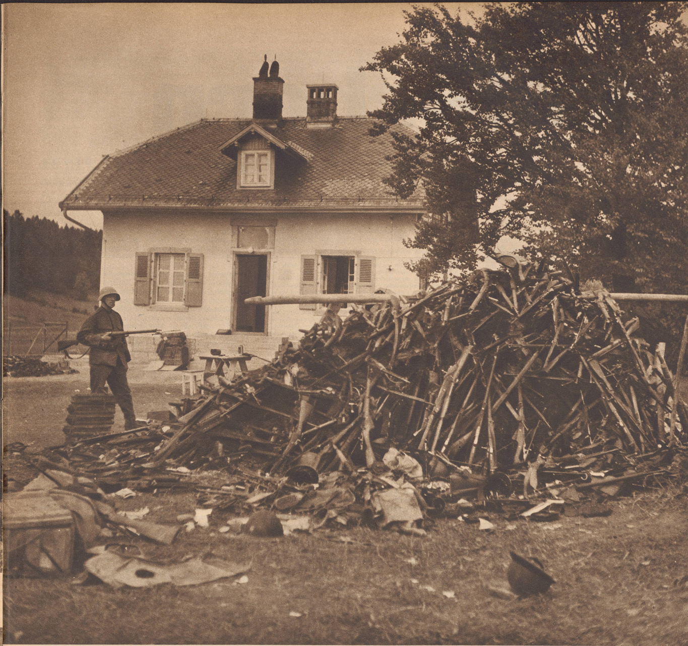
Einsamer Grenzort im Berner Jura. Nach Tausenden zählende Gewehre, Revolver, Handgranaten, Munition und Stahlhelme einer polnischen Division. Les milliers de fusils, de revolvers, de grenades à main, de munition et de casques d'une division polonaise, entreposés près de la frontière dans le Jura bernois. N/S 1042