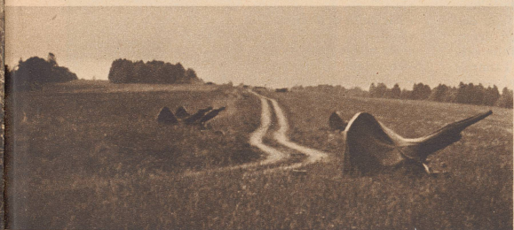
Verlassene französische Flab-Geschütze an einem Feldweg im Jura. Sur un chemin de campagne, dans le Jura, des canons anti-aériens français ont été abandonnés. N/S 1087