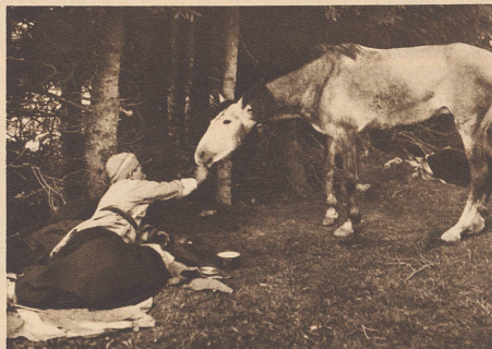
Gute Kameradschaft. Spahi mit seinem Hengst im Biwak bei Saignelégier. N/F 894

Chevaux de trait d'une division polonaise, au bivouac à Courroux.