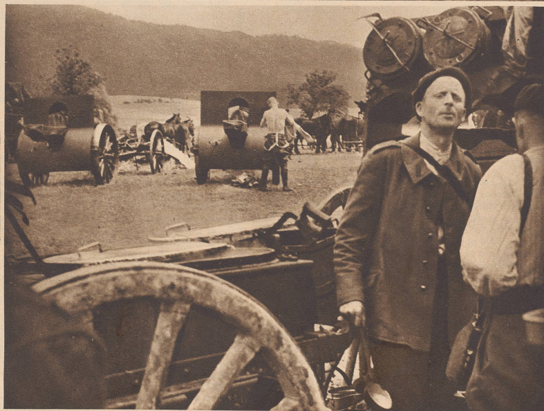
Auf einer großen Wiese an der Sorne bei Courroux lagern Reste des polnischen Heeres, drei Batterien Artillerie mit 155-mm-Geschützen. Die Polen hatten, den Rückzug der Franzosen nach der Schweizer Grenze deckend, zuletzt St. Hippolyte verteidigt und beschossen. Sie brachten ihr Kriegsmaterial vollständig mit in die Schweiz. Près de Courroux, sur un grand pré campent les restes de l'armée polonaise, avec trois batteries de canons de 155 mm. Les Polonais couvrirent la retraite des soldats français vers la frontière suisse en défendant jusqu'au dernier moment St-Hippolyte.