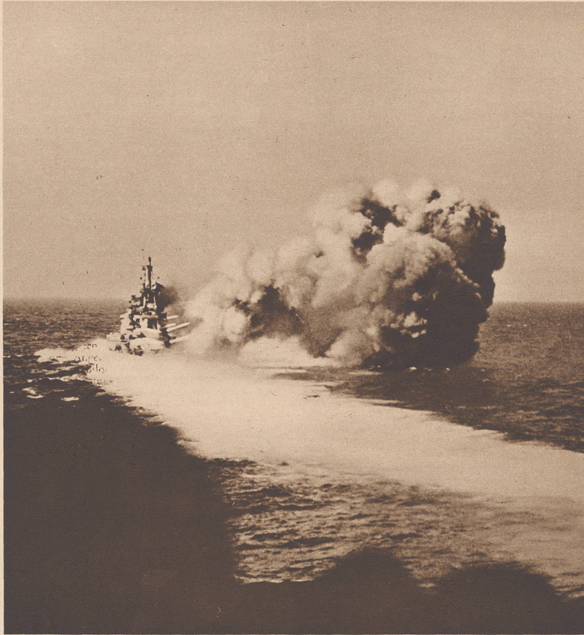
Eine Salve des italienischen Schlachtschiffes «Cavour» beim Seegefecht im Jonischen Meer am 9. Juli, 14 Uhr. Ueber den Ausgang dieses ersten großen Treffens zwischen italienischen und britischen Einheiten liegen vollständig widersprechende Nachrichten vor. Italienischerseits soll der Zerstörer «Zeffiro» gesunken sein. Die Engländer verloren zwei Einheiten.

En mer ionienne s'engageait, le 9 juillet, le premier combat naval italo-anglais, combat au cours duquel les Italiens perdirent le torpilleur «Zeffiro», tandis que les Anglais voyaient couler deux de leurs destroyers. Photo: Une salve du croiseur de bataille italien «Cavour».