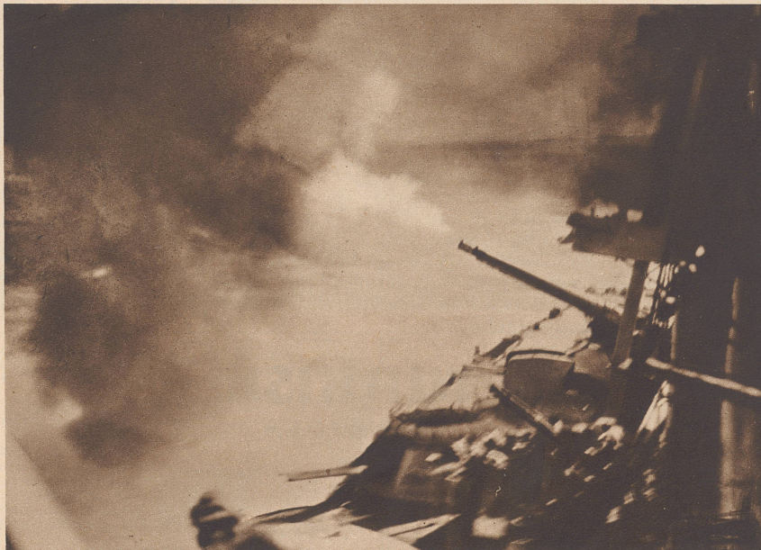
Das italienische Schlachtschiff «Giulio Cesare» im Gefecht.

En mer ionienne s'engageait, le 9 juillet, le premier combat naval italo-anglais, combat au cours duquel les Italiens perdirent le torpilleur «Zeffiro», tandis que les Anglais voyaient couler deux de leurs destroyers. Photo: Une salve du croiseur de bataille italien «Cavour».