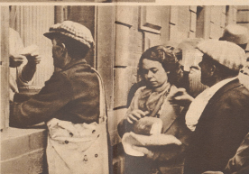
Deutsche Soldaten verteilen Brot an die zurückkehrende Bevölkerung. Les soldats allemands assurent la distribution du pain aux rapatriés.