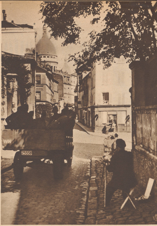
Es ist nicht mehr der Auto-Car mit amerikanischen Touristen, sondern ein Lastwagen mit deutschen Soldaten, der durch die wackeligen Gassen zum Monstrum hinauffährt; aber am Steuerende sitzt noch wie vormals der Fahrer und reißt sich an Licht und Schatten. Monstrum. Si les camions de l'armée allemande ont remplacé les cars de s'Auto Paris by night, la trace des bobines et l'éclairage des pontons n'a pas disparu de la Baie.