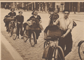
Flüchtlinge, welche die Hauptstadt vor dem Einmarsch der Deutschen verlassen haben, kehren aus der Provinz nach Paris zurück. Peu à peu ceux qui ont quitté Paris avant l'entrée des Allemands réintègrent la capitale.