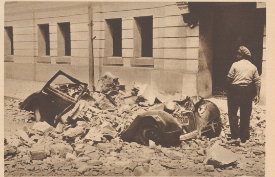
Total zerstörtes Automobil das vom herabstürzenden Gerüst getroffen wurde. Von diesem Hause wurde das obere Stockwerk vom Boden buchstäblich abgetrennt und auf die Erde geworfen, während die unteren Stockwerke und besonders das Erdgeschoss relativ wenig Schaden nahmen. Une automobile écrasée par les pierres d'un immeuble sont ibasés.