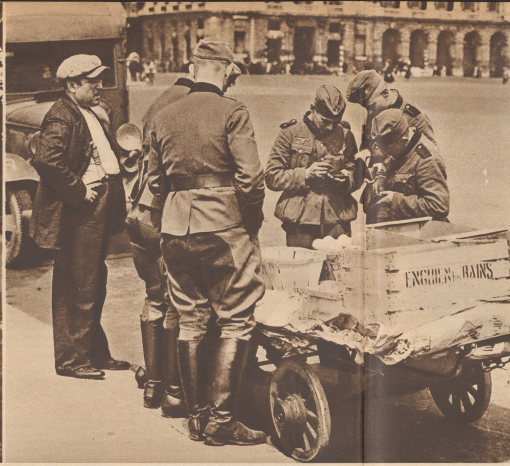
Deutsche Soldaten kaufen sich auf einem Auktion durch die Straße Orangen und Bananen bei einer sogenannten 'Marchande des quatre saisons'. Die Unternehmung der Währung, obwohl einige Schwergewichte zu machen, ist vollständig mit dem Ansehen 1 Mark gleich 20 französische Franken. Le marchand des quatre saisons connaît une nouvelle clientèle. A raison de vingt francs pour un mark, les soldats du Reich sont riches.