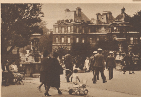
Deutsche Soldaten neben Einkäuflichen im Luxemburgergarten, einem beliebten Spazierpark der Provinz. Im Hintergrund der Luxemburgergärten, der Site des französischen Senats. Casquette plate, uniformes «feldgrau» déambulent dans les allées de Luxembourg.