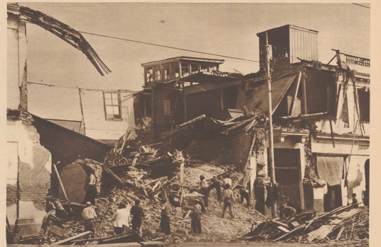
Die schwerbeschädigte Markthalle von Lima. Ein Dutzend Menschen fanden hier den Tod. Rare, sont les maisons qui ne portent pas de traces du tremblement de terre. Les débris de Lima se sont éparpillés. Une douzaine de personnes y trouvèrent la mort.

Pour une fois ce ne sont point des visions de guerre. En raison des circonstances, ces deux photographies du tremblement de terre qui, le 24 mai 1940 à 11 h. 35, bouleversa le Pérou nous sont parvenues avec un grand retard. Le rédacteur suisse établi à Lima qui nous les adressa écrit que ce séisme fut le plus violent qui fut enregistré sur la côte ouest de l'Amérique du Sud depuis 80 ans. Il dura exactement une minute, provoquant dans la capitale péruvienne la mort de 500 personnes et 6000 blessés.