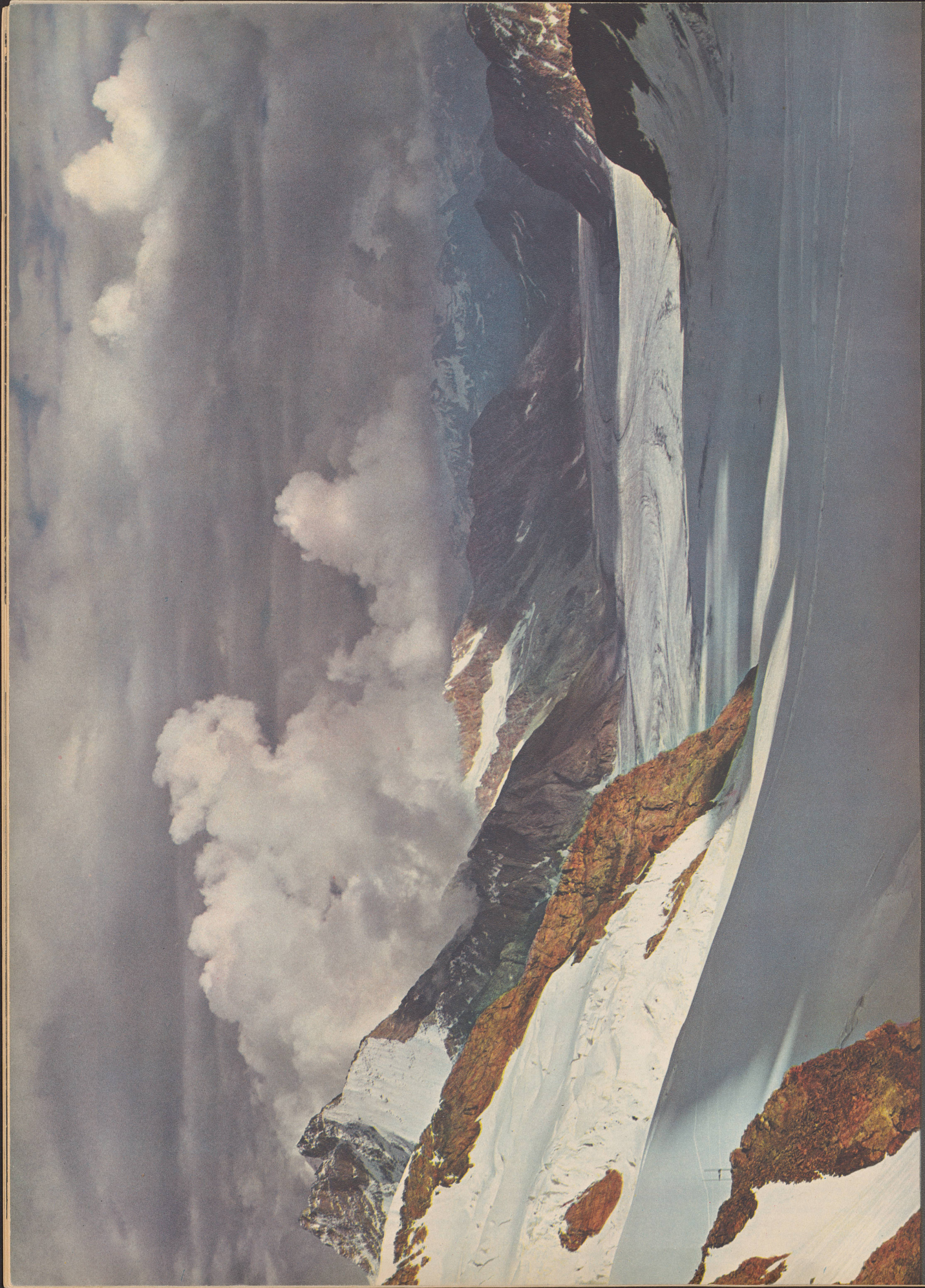
Der große Aletschgletscher im Abendlicht, vom Jungfraujoch aus gesehen «Salut glaciers sublimes» Le glacier d'Aletsch, vu du Jungfraujoch

Bebildlich bewilligt am 9. Juli 1910, gemäß 1888, vom 3. Oktober 1899. Photochor-Tidfrukt Cassatt & Huber, Zürich