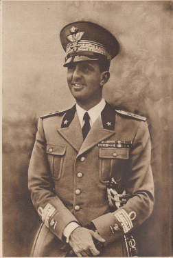
Umberto II Savoia Friedrich von Florenz, Kronprinz von Italien seit 1938 Generalinspektor der Infanterie, Oberkommandierender der 1. Heeresgruppe Nord. S. A. R. et J. Umberto de Savoie, Prince de Piémont, héritier de la Couronne d'Italie, inspecteur général de l'Infanterie et chef des armées du Nord.