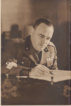
General Ubaldo Soddu Unterschiedlich im Generalstab des Heeres. Général Ubaldo Soddu, sous-chef de l'E. M. G. de l'armée.