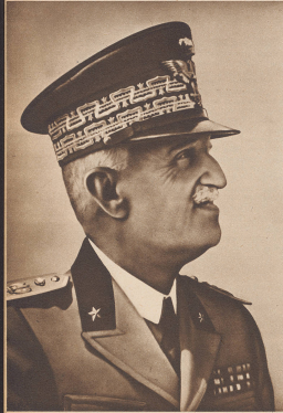
Viktor Emanuel III. König von Italien und Kaiser von Äthiopien, ab 1928 Befehlshaber aller italienischen Land-, See- und Luftstreitkräfte. S. M. Victor Emmanuel III, roi d'Italie et empereur d'Éthiopie, chef suprême des armées de terre, de mer et de l'air.