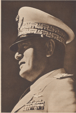
Benito Mussolini Ministerpräsident, Kriegsminister, Kommandant sämtlicher Truppen mit allen Titeln und Ehren. Marschall des Imperiums. S. E. Benito Mussolini, président du conseil des ministères, ministre de la guerre, commandant en chef des troupes combattantes sur tous les fronts, premier maréchal de l'Empire.