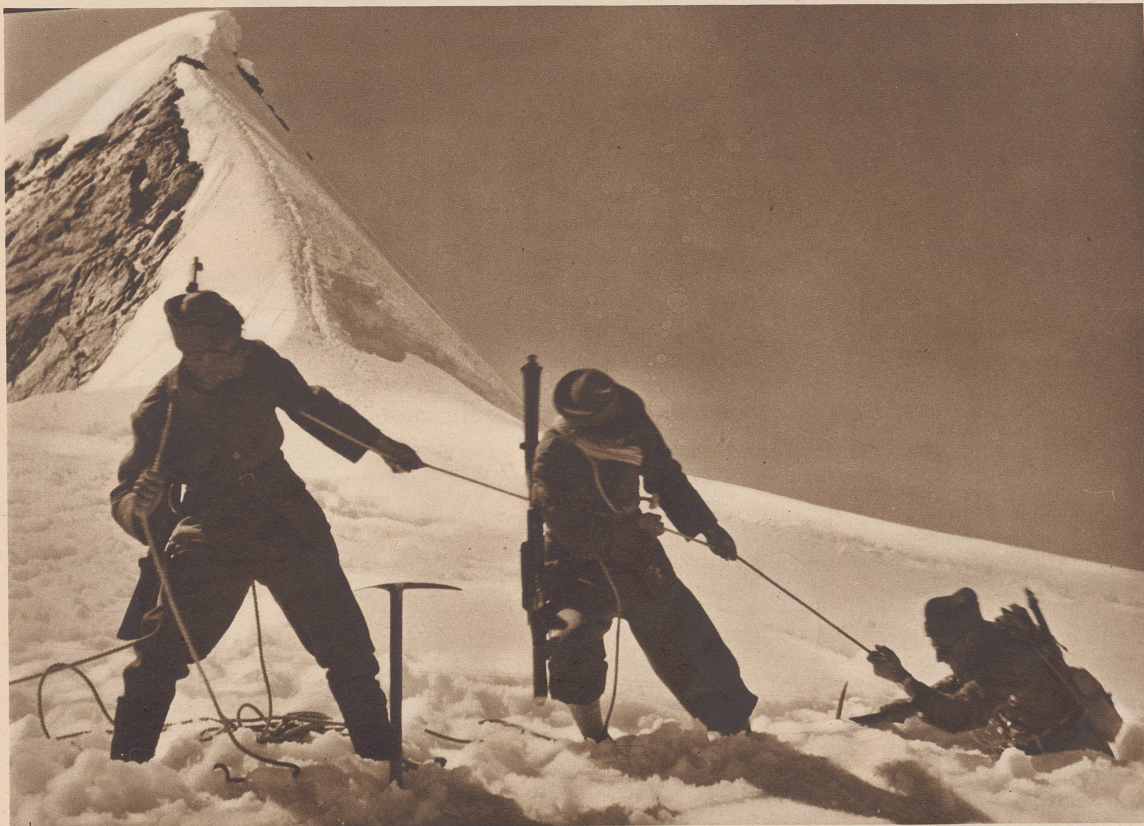
Errettung aus der Gletscherspalte. Mit vereinten Kräften befördern zwei Mann einer Seilschaft ihren plötzlich in einer Spalte verschwundenen Kameraden rasch wieder ans Tageslicht. Le sauvetage d'un homme tombé dans une crevasse du glacier de Gletsch. Tirant de toute leur force sur la corde, deux officiers sortent de sa fâcheuse position leur camarade disparu dans une crevasse. N. F. 1665