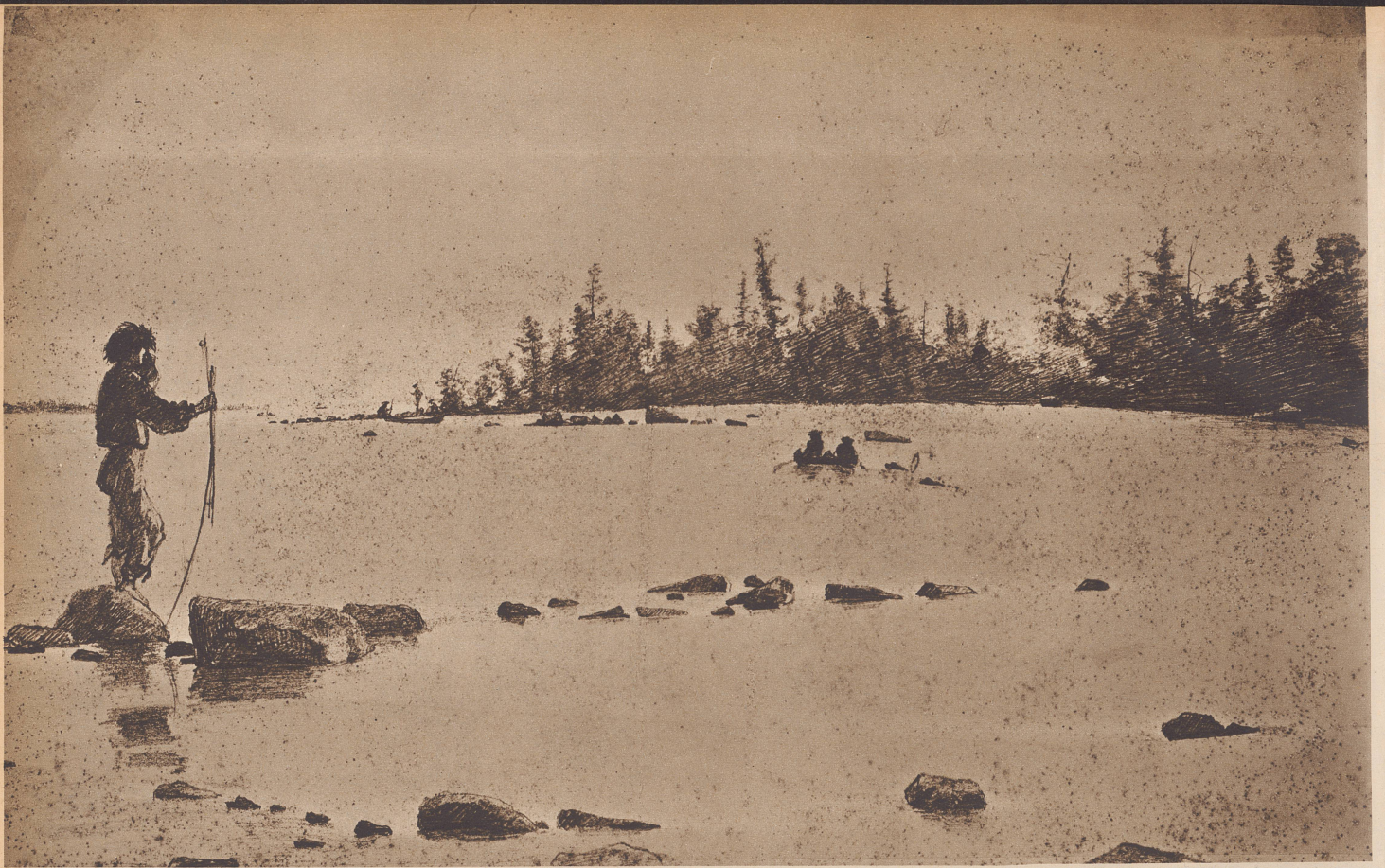
Am Lake Superior bei den Stromschnellen von St. Mary. Nicht nur Staatsleute und Farmer portraitiert Buchser in Amerika, er begleitet Heere auf ihren Feldzügen und vertieft sich in das Leben der Indianerstämme an den Stromschnellen von St. Mary.

Au bord du lac Supérieur, les rapides de Ste-Marie, en Amérique.