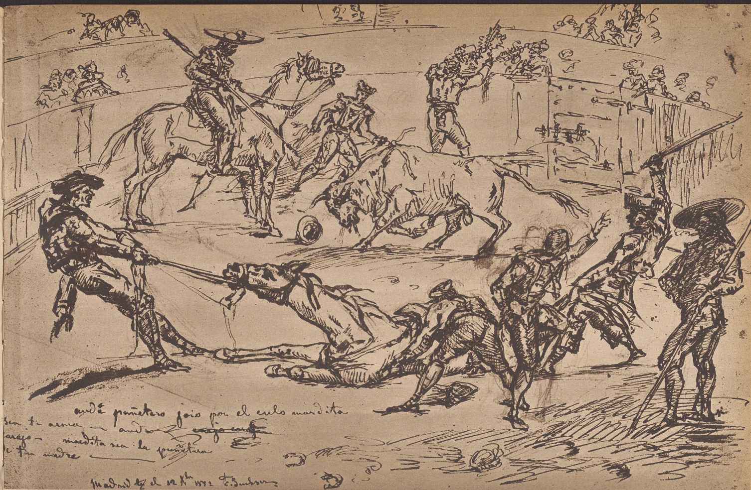
Stierkampfszene in Madrid, 1852. Pferde gehörten schon im väterlichen Bauernbetrieb zur Liebe des Künstlers. Er zeichnet sie in allen Weltgegenden mit einer so vertrauten Kenntnis ihres Daseins, als verstünde er nicht nur deutsch, italienisch, spanisch und englisch, sondern auch die Sprache der Pferde. Scènes d'Espagne, combats de taureaux à Madrid. 1852.