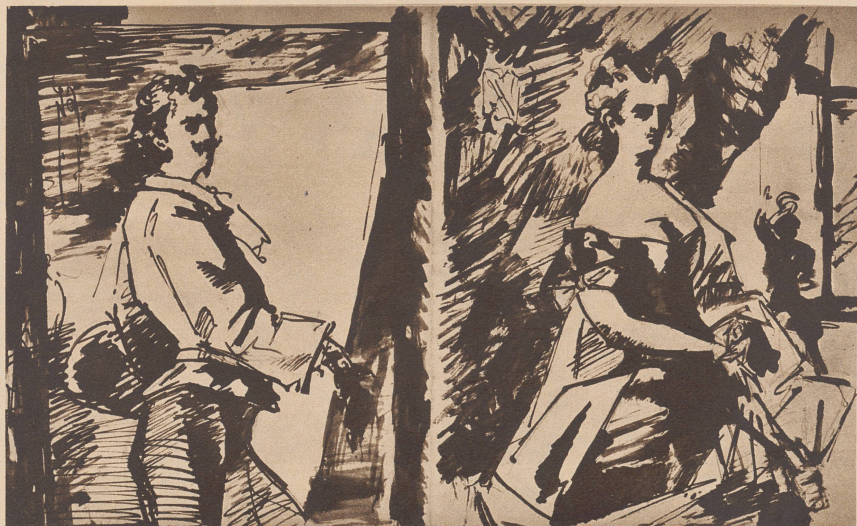
Selbstbildnis des Solothurner Malers Frank Buchser mit einem Modell in Madrid, 1853. Der 25jährige, aufs Geratewohl in das Land des Velasquez gezogene Maler schreibt in sein Skizzenbuch: «Hispanien ist groß, größer Europa, und wenn du darin kein Glück fändest, so bleibt dir noch die übrige Welt. Un galant'uomo trova sempre da vivere...»

Portrait du peintre par lui-même et l'un de ses modèles exécutés à Madrid, en 1853.