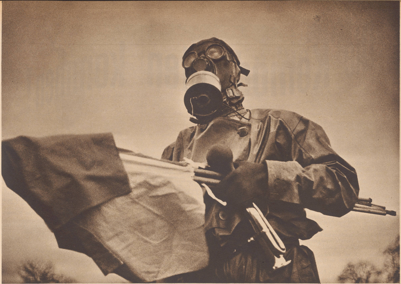
Der Yperit-Mann von 1936

Wir haben ihn im Jahre 1936 in der ZI gezeigt. Damals kannte man als einzigen Schutz vor dem seßhaften, hautschädigenden Senfgas nur den Yperit-Mann, der, ausgerüstet mit kostspieligen Gewändern, die das sonst alle Kleidungsstücke durchdringende Gift abhalten, verdächtiges Gelände durchschreitet, durch die Umfärbung eines Reagenzpapiers das Vorhandensein des gesuchten Giftes feststellen und ein Warnsignal anbringen kann. Das frühzeitige Erkennen des gefährlichen Kampfgases war bis jetzt die einzig mögliche Waffe gegen seine schweren, schädigenden Folgen. Cette photo, parue en 1936 dans le ZI, nous montre les précautions prises, en ce temps-là, contre les attaques d'ypérite. Ce costume approprié et très compliqué était jusqu'à la découverte de l'Ypox, le seul moyen de protection connu.