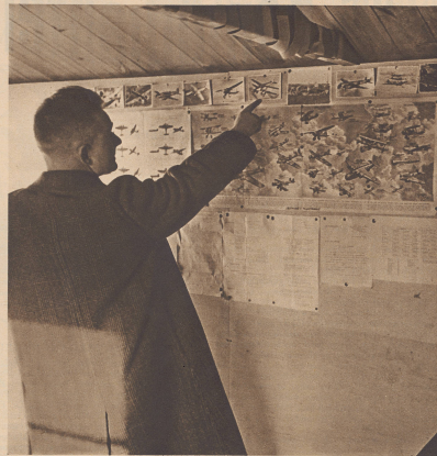
Der ganzen englischen Küste entlang stehen einfache Barschen, in denen die Beobachter tätig sind. An den Wänden erblickt der Beobachter stets sämtliche Flugertypen, die eigenen und die feindlichen, und von seiner Wachtstube hängt es ab, daß der eintreffende Feind von Portsmouth auf seinem Luftwege verfolgt wird. Sur tout le territoire anglais sont disposés des postes d'observation. L'observateur doit être à même de reconnaître tous les différents types d'appareils anglais et ennemis. La moindre indication de sa part équivaut à une catastrophe en marche. L'avis repéré est aussitôt signalé.