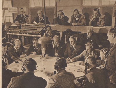
Die Männer rings um den Tisch erhalten ständig Nachrichten und Anweisungen durch die einzelnen Beobachter. Je nach dem Inhalt der eingehenden Nachrichten bewegen sie farbige Markierungen auf dem ihnen zugewiesenen Kartenschilder. Oben sitzen die Beobachter, die während des Hauptquartiers der Royal Air Force von den Vorkommissaren in ihren Abteilungen berichten. All diese Männer arbeiten Tag und Nacht in verlässlicher Abfolge. Au point d'écoute, l'homme qui reçoit le message dispose sur la carte finale devant lui un jeu de couleur correspondant à la position de l'aeronavigateur. Les hommes répartis sur le grand appareil démontrent les yeux fixés sur la table centrale. Dès que les appareils ennemis approchent d'un objectif important, ils alertent aussitôt les chasseurs et la D. C. A.