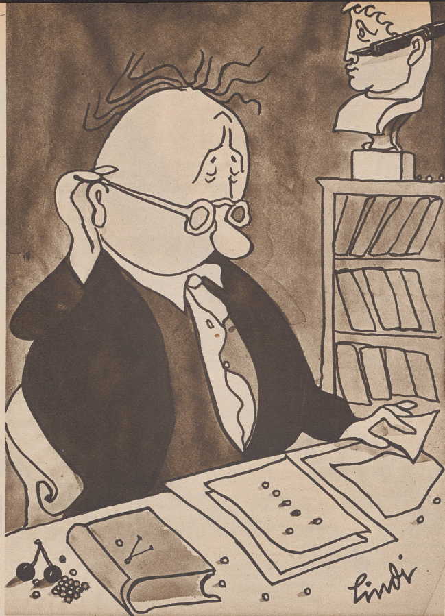
Der Professor. «Eigenartig, einen Moment — mein Stylo war doch eben noch hinter dem Ohr...» — C'est incroyable, il me semblait avoir mis mon stylo à l'oreille.

«Keine Spur, ich leiste mir nur eine kleine Arbeitspause. Ich bin nämlich von Beruf Komiker.»