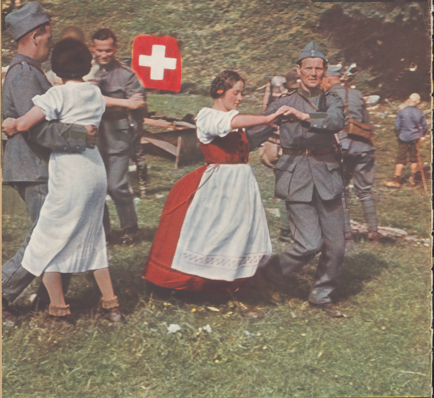
Photo Vogel — Photocolor-Tiefdruck Konzett & Huber, Zürich — VI S 5784