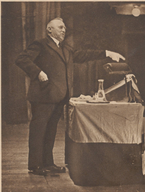
Bundesrat Rudolf Minger seit 1929 Vorsteher des Eidg. Militärdepartements. M. le conseiller fédéral Rudolf Minger, chef du département Militaire, élu en 1929.