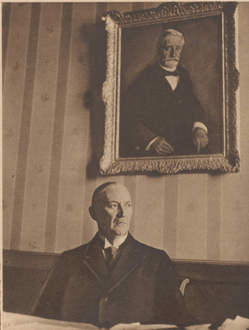
Bundesrat Dr. Johannes Baumann seit 1934 Vorsteher des Eidg. Justiz- und Polizeidepartements. M. le conseiller fédéral Johannes Baumann, chef du département de Justice et Police, élu en 1934.