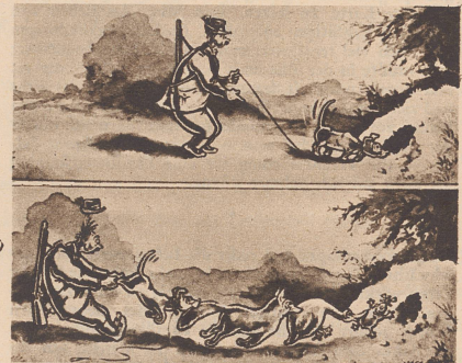
Echtes Jägerlatein Histoire de chasse

«Ja, die Zeiten sind anders geworden, heutzutage sprechen die Leute nicht mehr miteinander!» — Les temps ont bien changé, de nos jours les gens n'échangent plus d'idées.