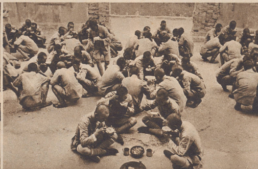
Zu den Mahlzeiten versammelt sich die ganze Rekrutenschule auf dem Kasernenhof. Gruppenweise sitzen die jungen Soldaten beisammen und verzehren mit Hilfe der Eßstäbchen ihren «Spatz». Er besteht in China wenigstens einmal täglich aus Reis, gehacktem Fleisch und Gemüse.

La cour de la caserne tient également lieu de salle de théorie. Assises à même le sol, les recrues suivent avec attention les explications de l'instructeur.