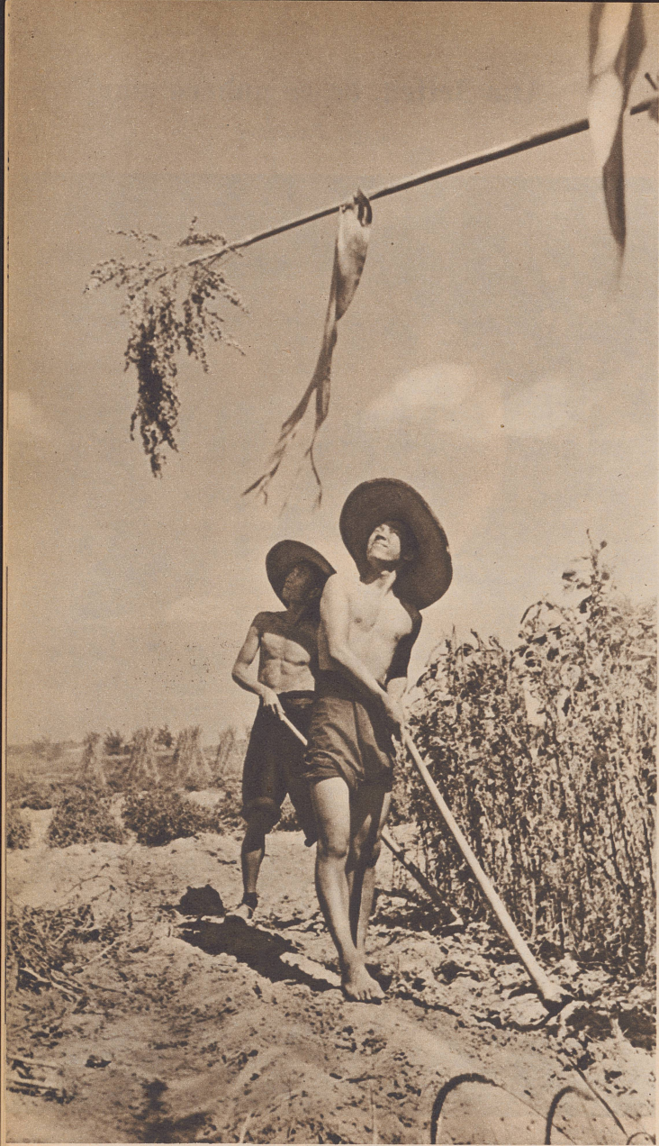
Der chinesische Bauer bei der Arbeit auf dem Feld. Plötzlich aber war es aus mit dem Frieden und der Ruhe im Lande. Japanische Bombengeschwader brausen seit drei Jahren übers Land und werfen ihre verheerende Last über die Dörfer ab. Der Bauer legte seine Hacke aus der Hand und meldete sich zum Militär.

Depuis trois ans, la paix de la région est troublée par le vol des escadrilles japonaises. Le paysan chinois dépose ses outils et va s'engager au bureau de recrutement.