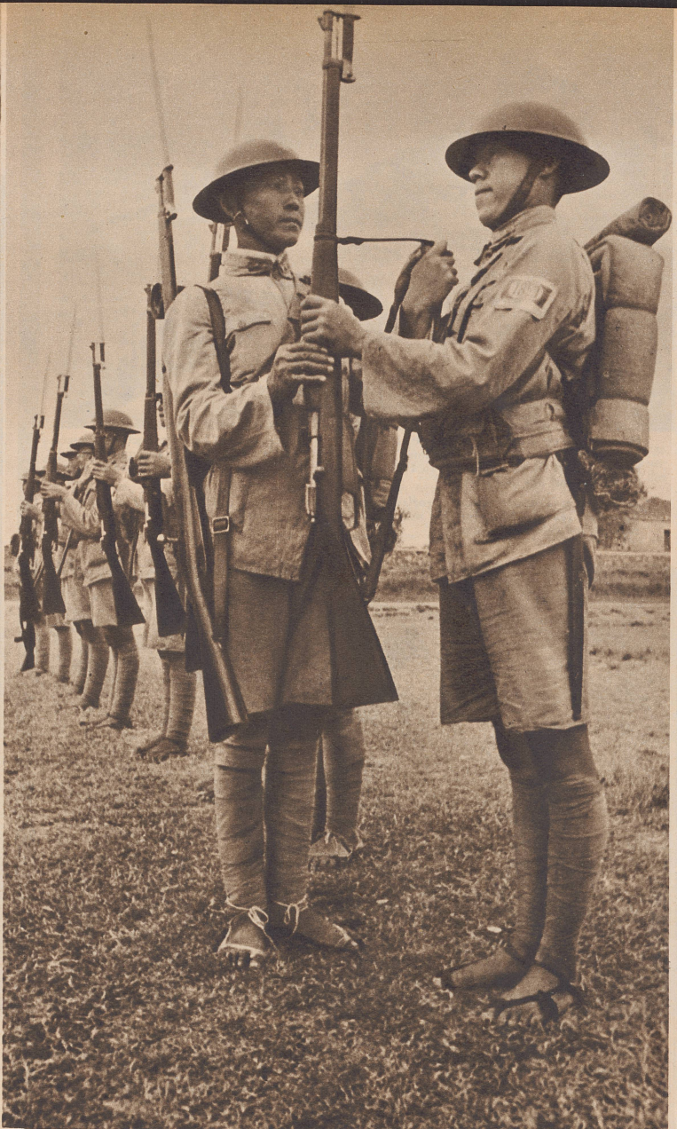
Der chinesische Bauer bei der Arbeit auf dem Feld. Plötzlich aber war es aus mit dem Frieden und der Ruhe im Lande. Japanische Bombengeschwader brausen seit drei Jahren übers Land und werfen ihre verheerende Last über die Dörfer ab. Der Bauer legte seine Hacke aus der Hand und meldete sich zum Militär.

Depuis trois ans, la paix de la région est troublée par le vol des escadrilles japonaises. Le paysan chinois dépose ses outils et va s'engager au bureau de recrutement.