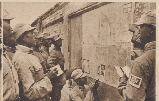
Eine große, von Hand geschriebene Wandzeitung auf dem Kasernenhof berichtet täglich über die Ereignisse auf den verschiedenen Kriegsschauplätzen. Mit großem Interesse verfolgen die Rekruten den Verlauf des Krieges, denn beinahe jeder besitzt einen Freund oder einen Verwandten an irgendeiner Front.

La cour de la caserne tient lieu de réfectoire. Les hommes s'y rassemblent par groupes autour du «spatz», lequel «spatz» est ici du riz, des légumes et de la viande.