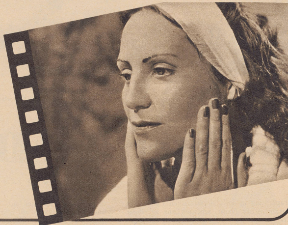
Bild aus dem Hamol-Film, der jetzt in den Kinos läuft.

Im Kino zeigte Ihnen der Hamol-Film wie man den jugendfrischen Teint bis ins Alter hinein erhalten kann