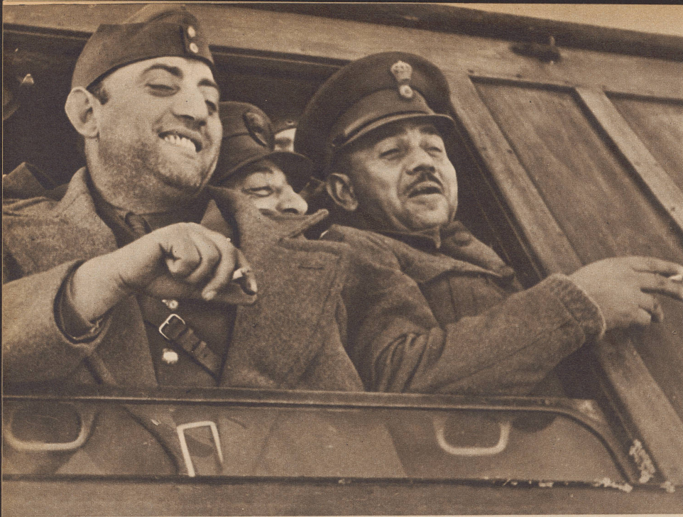
Griechische Offiziere auf der Fahrt zur Front in Albanien. Im gleichen Zug reiste unser Sonderberichterstatler von Athen an die Front. Officiers grecs quittant Athènes dans le train qui les emmène vers le front.