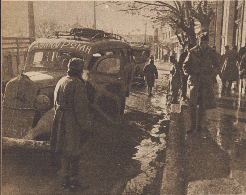
Viel Optimismus und Humor. Das Auto, das zur Front fährt, trägt die Aufschrift «Athen-Rom». Gemeint ist damit eine Fahrt von Athen nach Rom, nicht auf dem Seeweg, sondern über Albanien.