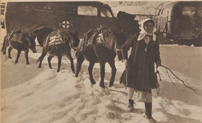
Autokolonnen des Griechischen Roten Kreuzes auf einem Umschlagplatz. Bis hierher konnten die schweren Wagen trotz der verschneiten und vereisten Straßen vorrücken. Hier nehmen sie die verwundeten Soldaten, die auf Ponys und Maultieren von den vordersten Linien kommen, in Empfang, um sie ins Lazarett in der Etappe zu führen.