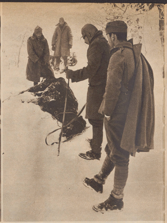
Das Ende eines treuen Helfers. Kälte und wahrscheinlich auch Strapazen und Hunger haben dem Bastpferd so zugesetzt, daß es einsank. Es war nicht mehr auf die Beine zu bringen und starb vor den Augen der Soldaten. Le froid et le manque de fourrage aussi sans doute ont eu raison de ce fidèle serviteur.