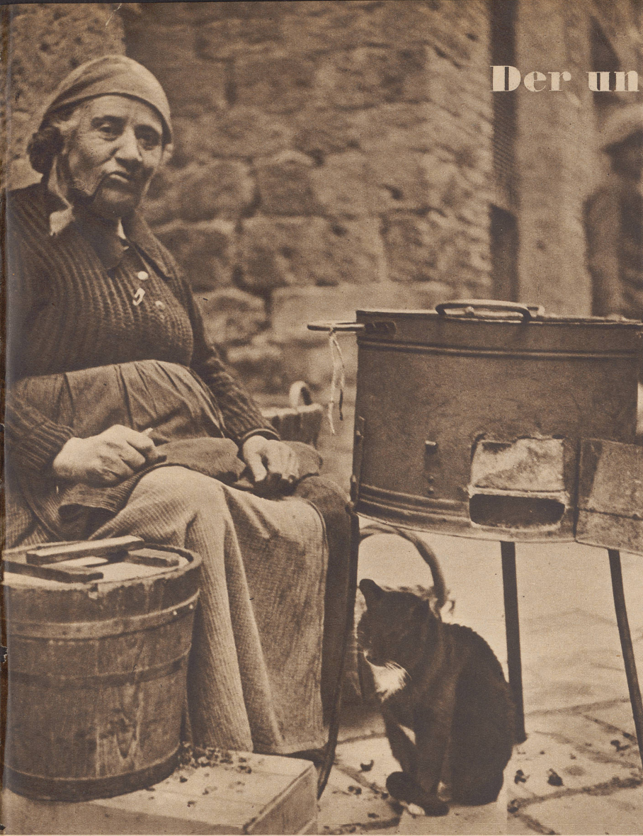
Der schwarze Kater flüchtet zum warmen Oefchen der Maroni-Frau. ...tandis que le chat cherche un peu de chaleur près du fourneau de la marchande de marrons.