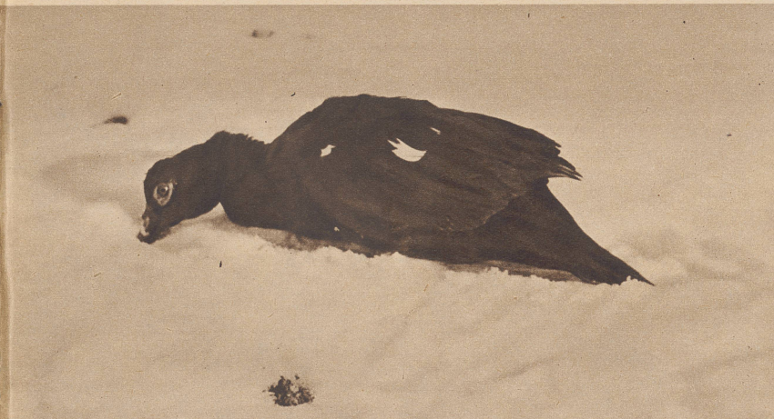
Die Ente versucht durch Eingraben mit dem unbekanntem kalten Etwas fertig zu werden. Le canard cherche à creuser dans cet étrange chose, inconnue et froide.