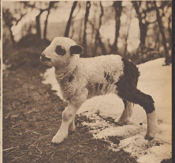
Das Lämmlein macht schon in jungen Jahren die Bekanntschaft mit dem Schnee, den die Tiere der Toscana sonst nicht zu fühlen bekommen. Dès son jeune âge, ce petit agneau fait connaissance avec la neige que les animaux de la Toscane n'ont pour ainsi dire jamais vue.