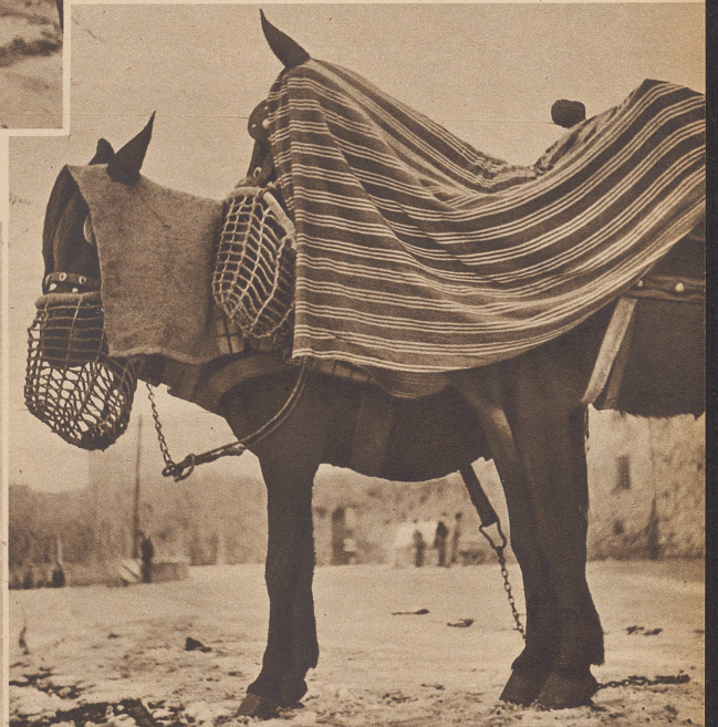
Die Maultiere unter der Sonne des Südens frieren. Ein wenig helfen die Decken gegen die ungewohnte Kälte. Les mulets, habitués au soleil du Sud, gèlent et pour les protéger un peu on les couvre de couvertures jusqu'aux oreilles.

Die ZI erscheint Freitags. • Chef-Redaktor: Arnold Kübler. Schweizerische Abonnementspreise: Vierteljährlich Fr. 3.85, halbjährlich Fr. 7.25, jährlich Fr. 13.65 bei Ueberweisung auf Postcheck-Konto Zürich VIII 3790 oder Barzahlung. Einzug per Nachnahme durchschnittlich 25 Rappen mehr. Abonnementsbezug durch ein Postamt 30 Rappen mehr. Auslands-Abonnementspreise: Bei Versand als Drucksache: Vierteljährlich Fr. 4.95 bzw. Fr. 5.30, halbjährlich Fr. 9.50 bzw. Fr. 11.05, jährlich Fr. 18.35 bzw. Fr. 21.45, je nach Ländergruppe. In den Ländern des Weltpostvereins bei Bestellung am Postschalter etwas billiger. • Verantwortlich für das Inseratenwesen: Werner Sinniger. • Insertionspreise: Die einspaltige Millimeterzeile Fr. -60, fürs Ausland Fr. -75; bei Platzvorschrift Fr. -75, fürs Ausland Fr. 1.-. Schluß der Inseraten-Annahme: 14 Tage vor Erscheinen. • Der Nachdruck von Bildern und Texten ist nur mit ausdrücklicher Genehmigung des Verlags gestattet. • Verlag, Druck, Expedition und Inseraten-Annahme: Conzett & Huber, Zürich, Morgartenstraße 29. • Telegramme: ConzettHuber. • Telefon 5 1790. • Imprimé en Suisse.