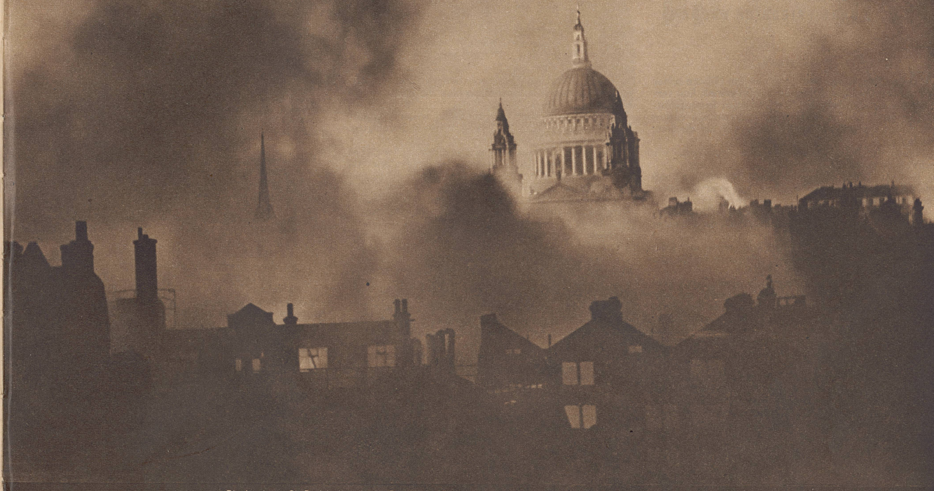
Die Londoner St. Paulskathedrale im Rauch und Flammenmeer nach dem deutschen Großangriff in der Nacht vom 29. zum 30. Dezember. Wunderbarerweise wurde diese Kirche nur ganz wenig beschädigt. La cathédrale londonienne de St-Paul, émergeant d'une mer de flammes et de fumée, après la violente attaque aérienne allemande de la nuit du 29 au 30 décembre. Par miracle, la cathédrale ne subit que de très légers dégâts.