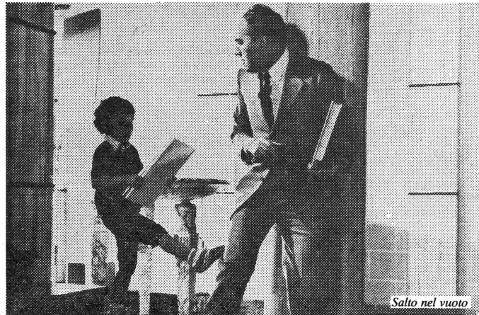
Salto nel vuoto

In «Salto nel vuoto» ist von Bellocchios geliebt-gehasstem Thema der «Familie» nur noch ein Torso – das Geschwisterpaar – übrig. Der Konflikt der beiden ist der Konflikt jeder Paarbeziehung: gegen- oder einseitige Abhängigkeit, Angst vor der Freiheit, die Alleinsein bedeutet, die Ausnützung des Partners, die Diskriminierung vor allem der Partnerin. Wer das allerdings am schiefen Gleichgewicht schuld ist, wer eigentlich der Schwächere und zum selbständigen Leben Unfähige ist, macht dieses Werk auf hintergründige und eindrückliche Weise deutlich. Ein Thriller mit umgekehrten Vorzeichen!