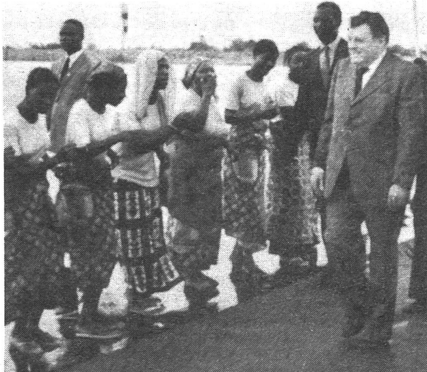
«Es sind eben nicht alle Menschen gleich»

Damit hat sich erfüllt, was der SPD-Parteivorstand und «Chefideologe» Peter Glotz in einem Spiegel-Essay (49, 1980) befürchtete: «...wenn die Konservativen sich in einen fragwürdigen Elitismus versteigen und die Linke darauf mit nichts anderem als egalitären Reflexen reagiert, wird das politische Sy-