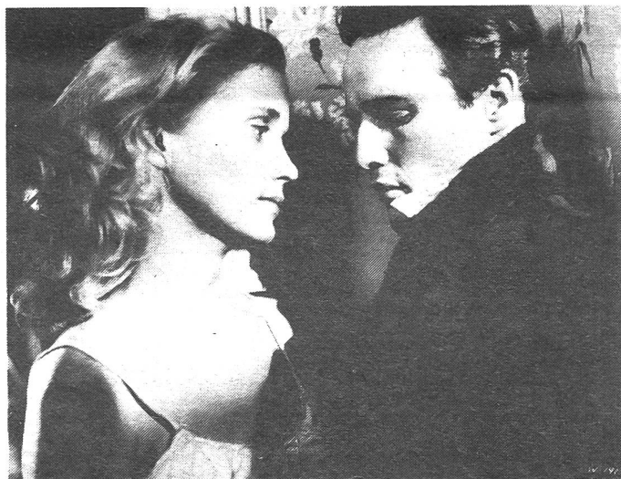
Elia Kazan: «On the Waterfront»