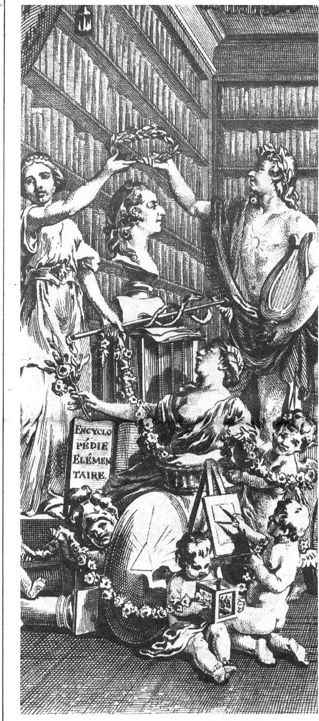
29. April: Anbetung des deus academicus v. oben links n. unten rechts: Die Wirtschaft, ER, der Staat, Professoren-gattin nebst Verbindungsstudenten.