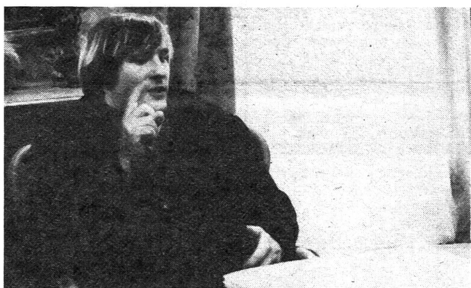
Gérard Depardieu in «Le camion».

voll und träumt dabei, er bekäme noch mehr und noch besser zu fressen. Dann wird er wieder ans Kreuz gebunden und stirbt in der Abendsonne, mit einem letzten Rülpsen. Ein Gleichnis über den Untergang des Subproletariats, eine Reflexion darauf, was der Film überhaupt abbilden könne.