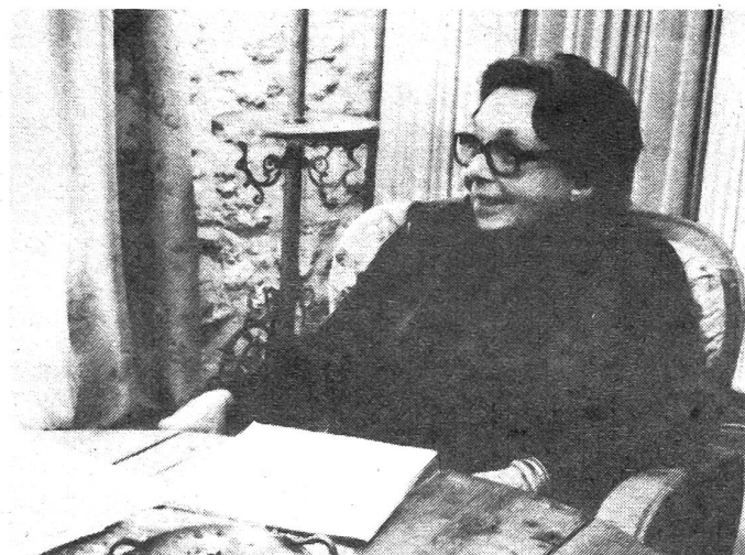
Marguerite Duras und...

In Pasolinis «Ricotta» spielt Orson Welles einen Regisseur,