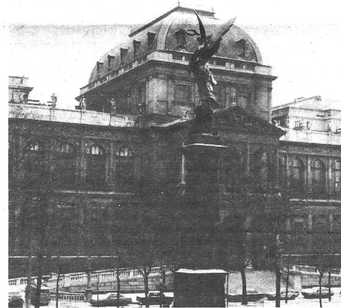
Das Hauptgebäude der Uni Wien