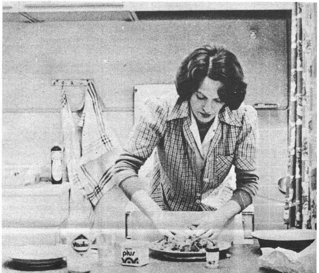
Die Macht des Alltags: Delphine Seyrig als Jeanne Dielman