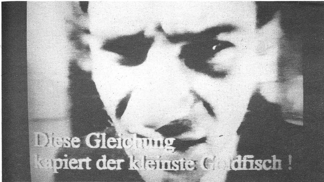
Morlove – durch die Videocomic-Technik entsteht ein neues Bilderlebnis.