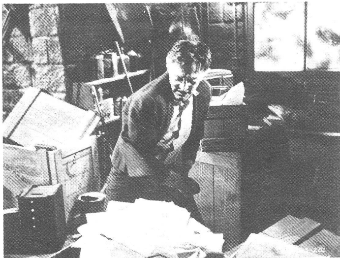
Zerstörung einer heulerischen Vergangenheit: Kirk Douglas in « The Arrangement ».