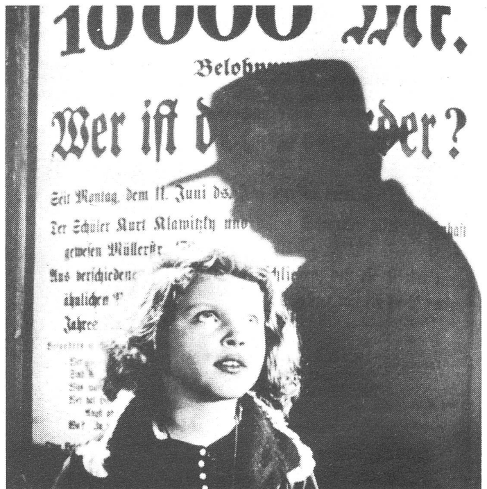
Mysteriöses Verschwinden von Kindern: M – eine Stadt sucht einen Mörder .