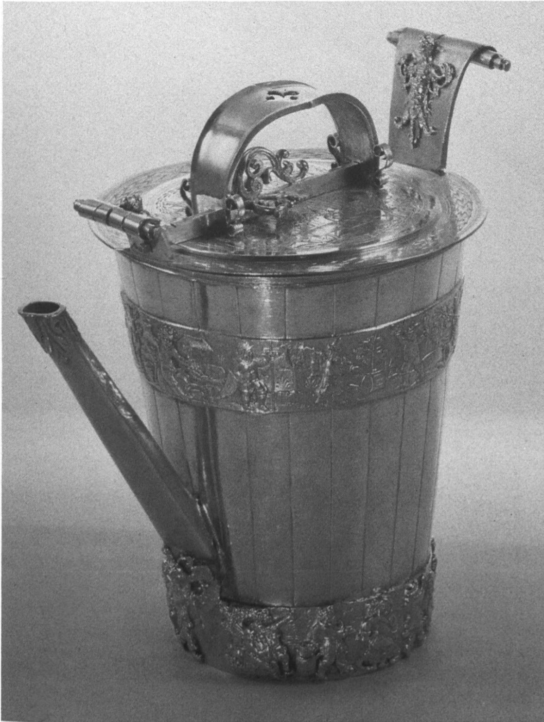
Abbildung 4: Schenkgefäß aus teilweise vergoldetem Silber der Zunft zu Weinleuten in Basel. Exakte, aber ins Künstlerische gesteigerte Nachbildung einer Holzgelte.