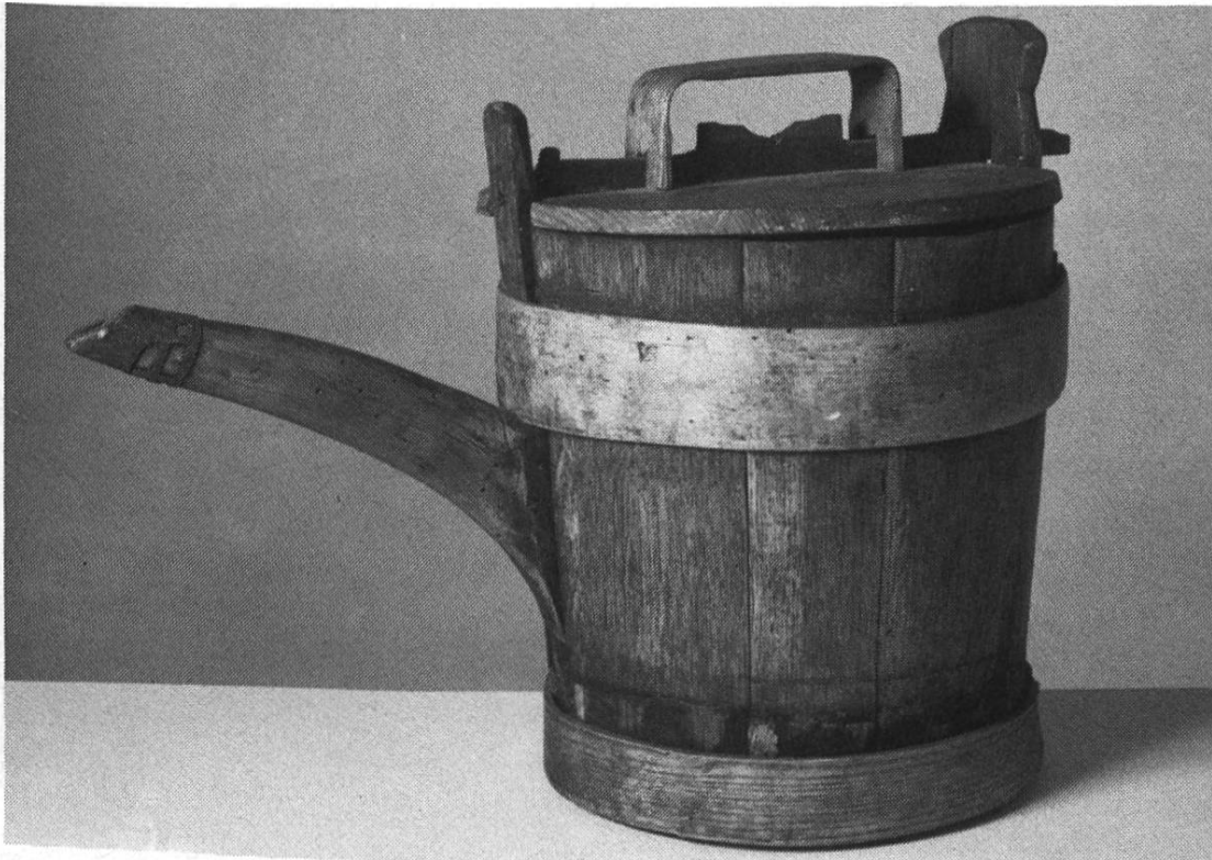
Abbildung 1a: Eine der drei hölzernen Weingelten von Albisrieden/Zürich.