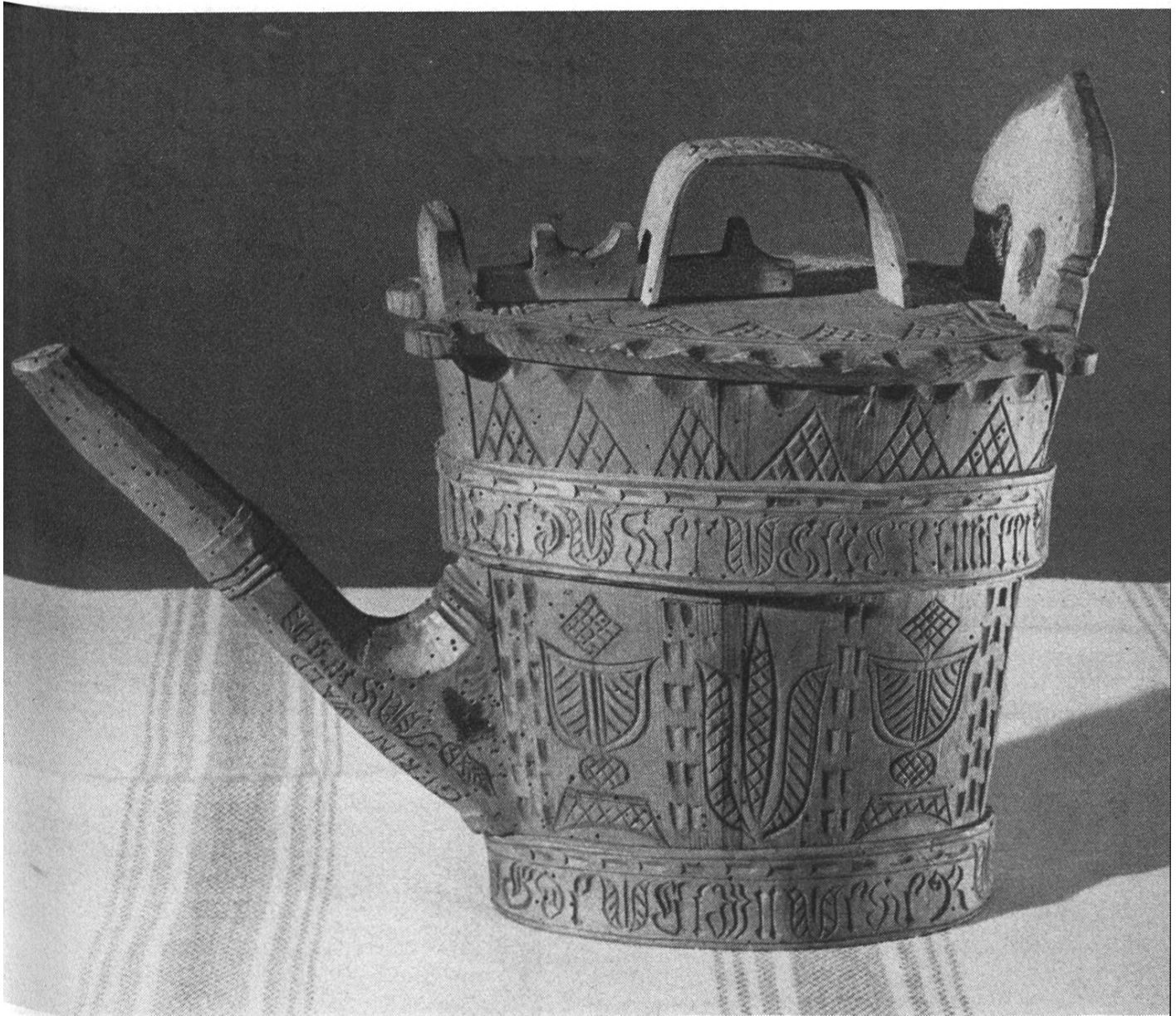
Abbildung 3: Abendmahlsgelte aus Erlenbach im Simmental, datiert 1725.