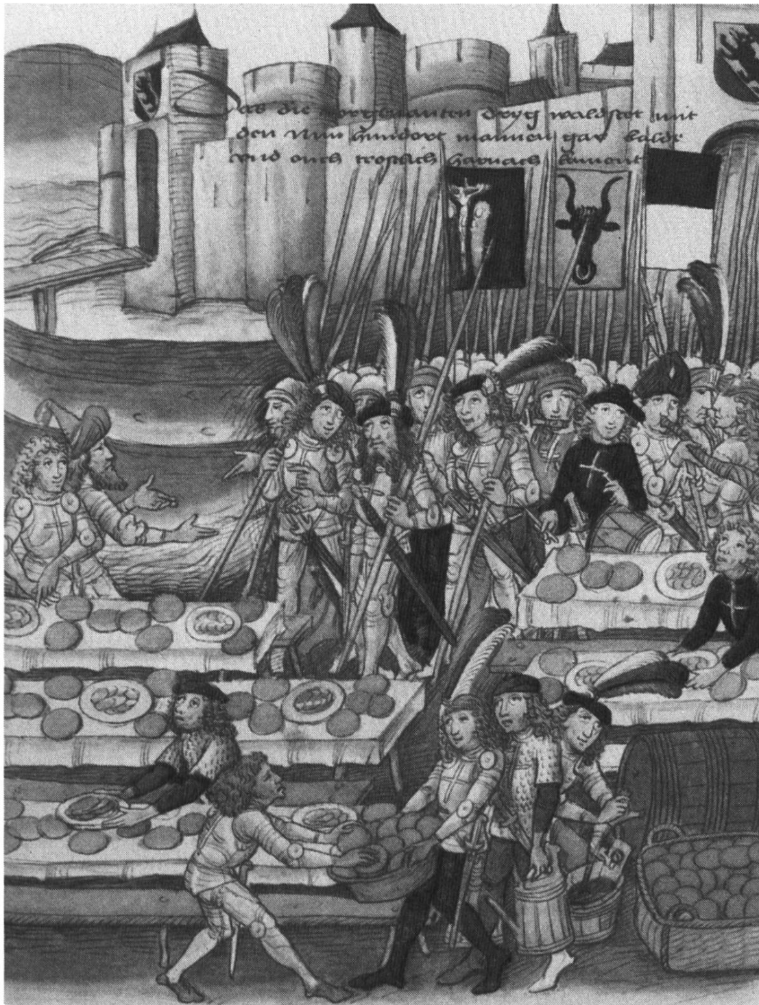
Abbildung 5: Private Berner Chronik des Diebold Schilling, 1484. «Bewirtung des eidgenössischen Zuzugs nach Laupen vor den Toren Berns, 1339.»